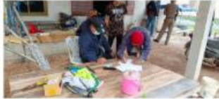
การตรวจค้นตามหมายค้นศาลจังหวัดร้อยเอ็ด