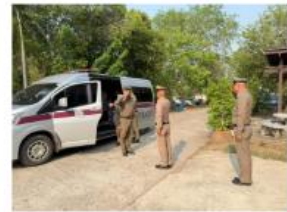
การตรวจราชการประจำปี 2568 ของ ก.จว.ร้อยเอ็ด