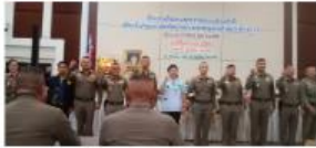
เปิดพิธีอบรมวิทยากรโครงการป้องกันปราบปรามยาเสพติดตามยุทธศาสตร์ชาติ ครู ช.