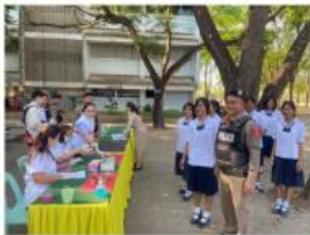
ร่วมตรวจโปสเตอร์เพื่อหาสารเสพติด นักเรียน