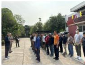
กิจกรรม 5 ส.ประจำเดือน