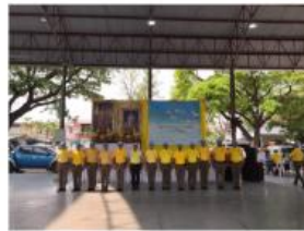
ร่วมกิจกรรมบริจาคโลหิต