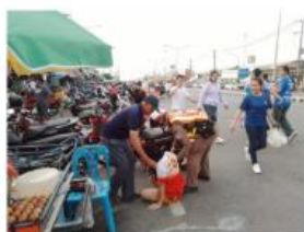
การกวาดขึ้นวันจราจร