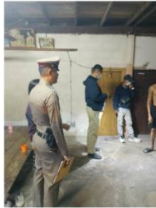
การตรวจค้นเป้าหมายสำคัญตามหมายค้นศาลจังหวัดร้อยเอ็ดที่ 73 ลง 20 มี.ค.68