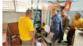
การตรวจสอบยุทธภัณฑ์ประจำปี 2568