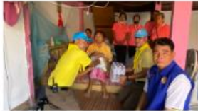
เยี่ยมผู้ป่วยติดเตียง