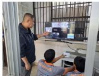
การปรับปรุง CCTV งานควบคุมผู้ต้องหา