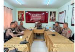
ประชุมขับเคลื่อนโครงการชุมชนยั่งยืน