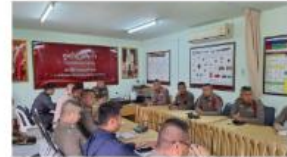
ประชุมประจำเดือน มี.ค.2568