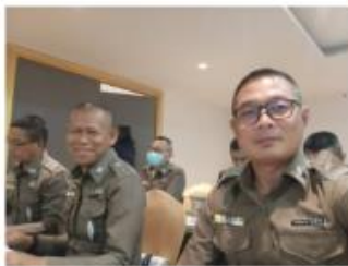
ร่วมอบรมโครงการพัฒนาประสิทธิภาพผู้ปฏิบัติงานด้านสิทธิมนุษยชนและการคุ้มครองสิทธิและเสรีภาพ