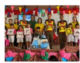
ให้ความรู้ขับขี่ปลอดภัย