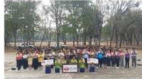
ให้ความรู้โทษของบุหรี่ไฟฟ้าแก่นักเรียน