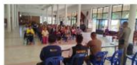
การขับเคลื่อนโครงการดำเนินงานตำบลยั่งยืน