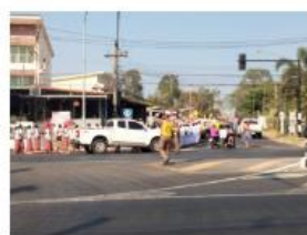
อำนวยความสะดวกการจราจรงานบุญคุณลานอำเภอจึงหาร